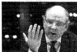
De justitiecommissie van de Vlaamse Parlement heeft een advies uitgebracht over de afschaffing van assisen. Het advies is dat de afschaffing van assisen schendt de grondwet. De commissie heeft ook gepleit voor een alternatief voor assisen, namelijk de zwaarte van de misdrijven.

Bron: Het Nieuwsblad, 21 december 2017, www.nieuwsblad.be/cnt/dm20171221_03255625